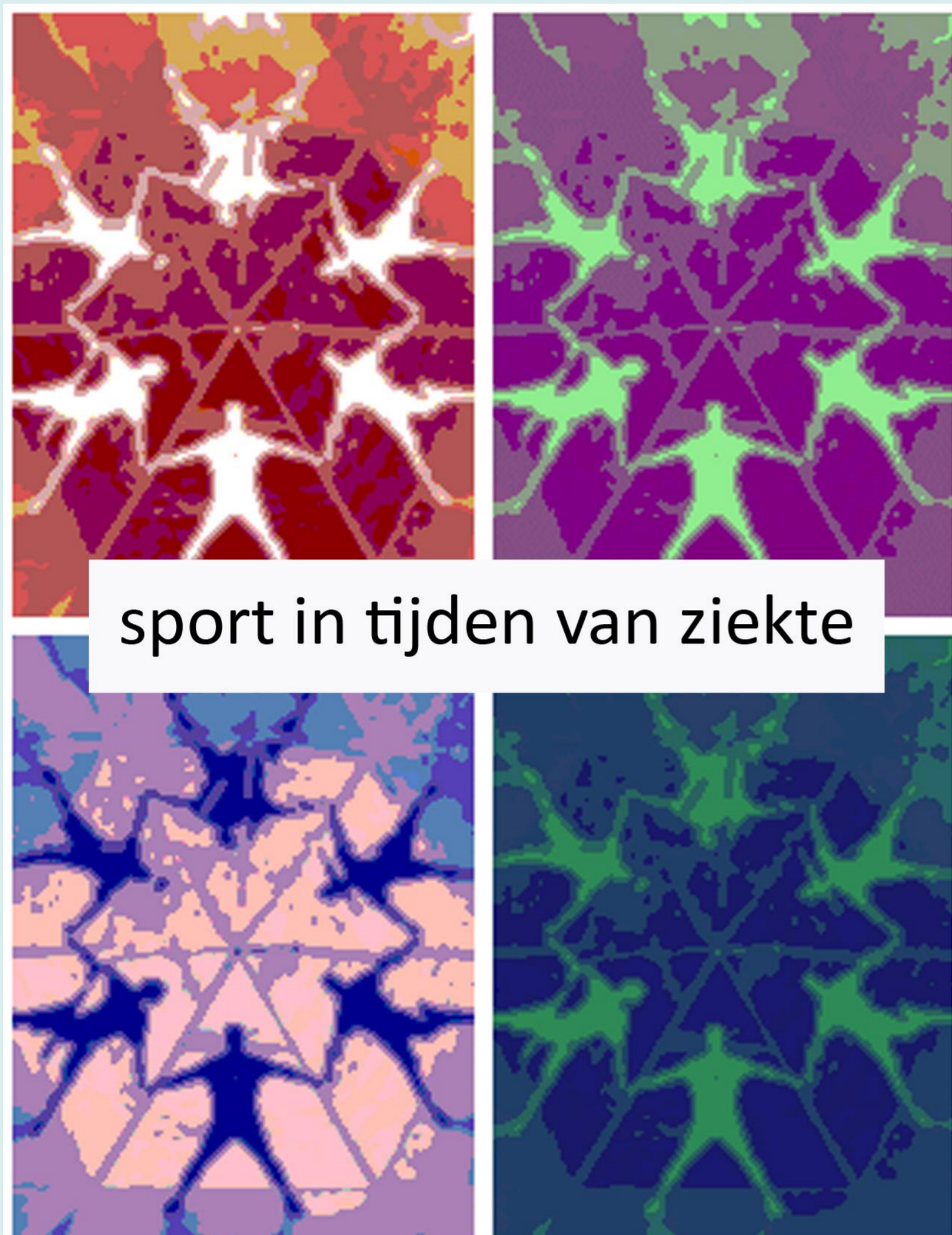
sport in tijden van ziekte

Narratief onderzoek naar betekenissen van sport en bewegen voor chronisch zieken en naar processen van betekenisgeving na de diagnose in de (para)medische context