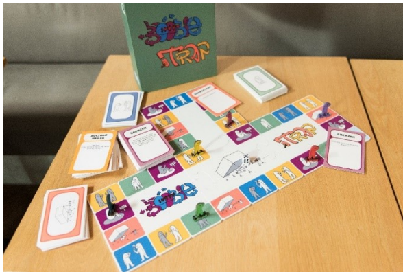
Het spel BoobieTrap

De jongeren (try out 1 en 2) hebben nog meegedacht over hoe het spel verbeterd kan worden. De jongeren gaven de tip dat 10 deelnemers eigenlijk teveel deelnemers zijn, je moet te lang wachten op je beurt. Zo kwamen we samen tot de conclusie dat het maximum aantal deelnemers 6 moet zijn. Verder hebben de deelnemers nog een aantal vragen bedacht zoals: hoever ga je bij een eerste date?; Hoe herken je een loverboy?; Wie mag over jou de baas zijn?; Hoe weet je of iemand seks met jou wil hebben? Ook bleken een aantal vragen niet onvoldoende duidelijk of was de uitleg te lang. De feedback is verwerkt in de daarop volgende versie.