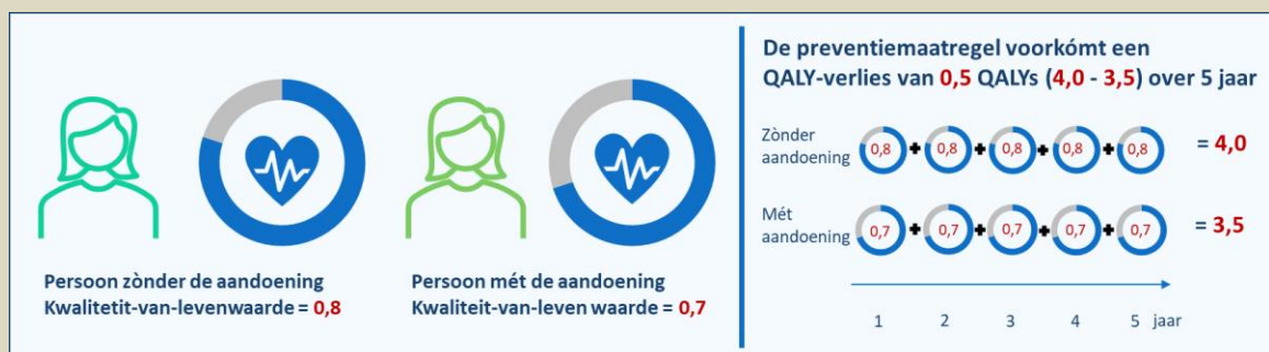
Figuur: Uitleg QALY-winst door een preventiemaatregel; deze Figuur is in aangepaste vorm overgenomen van het RIVM-rapport "De gezondheidsgevolgen van uitgestelde operaties tijdens de corona-pandemie. Schattingen voor 2020 en 2021" (13)

Stel dat het effect van deze preventiemaatregel 5 jaar standhoudt. Dan wordt er over de 5 jaar in totaal 0,5 QALY ( 0,1 \times 5 ) per persoon gewonnen. Zie ter illustratie onderstaande Figuur.